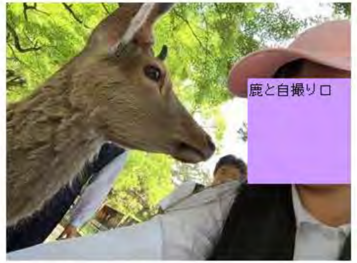
鹿笑ってるみたいな顔🐾