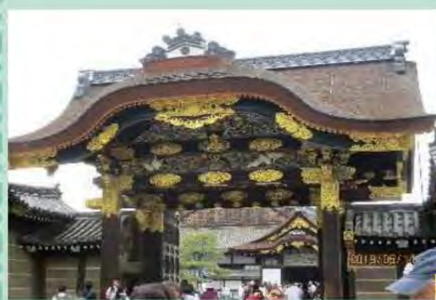
大政奉還の再現がとてもリアルだった。