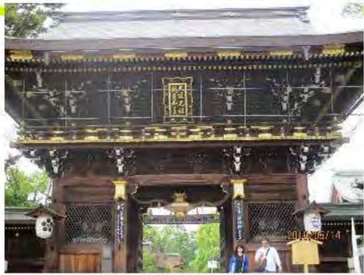
↑ 左右に道真公がまつられている。

菅原道真をまつる北野天満宮 ・北野天満宮の入り口には、撫で牛と言って、改善したい部分をさすると、さすった部分が良くなるといわれている像が複数存在している。頭をさすったけど、なぜか尻もさすられていて、金色になっていた。(笑) ・学業のおまもりを買うつもりでいたが、値段が1000円と、2000円の2つがあって、とても高くて驚いた。勿論1000円のものを買ったが、中には2000円のものを買っているツワモノもいた。 ・おみくじを買ったけど、学業のことはそこまで触れていなくて、恋愛のことばかり書いていた(笑) ・絵馬をのぞいたら、開成高校に合格するという絵馬がたくさんあってすごいなと思った。知ってる人の絵馬もあった。