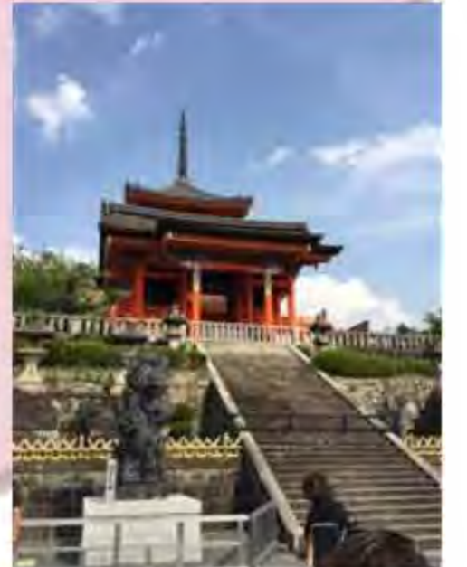
本殿からの景色がとてもきれいだったな^^

私たちが行ったときは改修工事であまり見られませんでした。景色がとてもきれいでした。