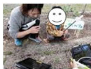
色や形をかんさつ