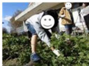
ピーナツのしゅうかく