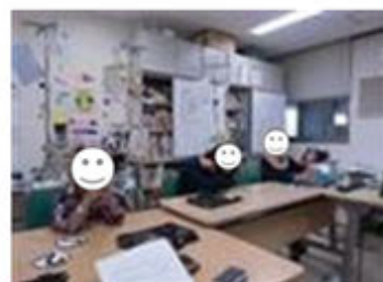
分教室のみんなと お話したよ！

ぼくに、畑のかんさつのことでしてほしいことや、しつもんがあったら、ふせんではってね(*'ω'*)