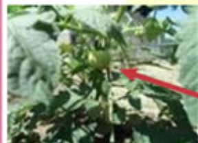
トマトのあかちゃん！