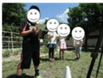
分教室のみんなに『こんにちは！』