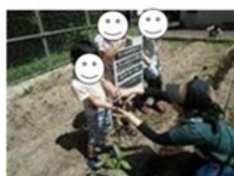
ピーマンや、たねまきの しょうかい。