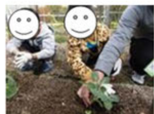
めきゃべつの うえかえ

今日は、畑のかんさつを分教室のみんなとしました。 まいたたねから芽(め)が出ていて、それぞれ大きさはかりました。 めきゃべつの植えかえと、ピーナツのしゅうかくもしました。