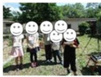
みんなでつながるの ってすてきだね！