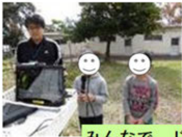
みんなで、じこしょうかい