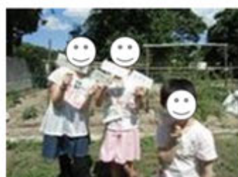
かわいいプレート ありがとう！