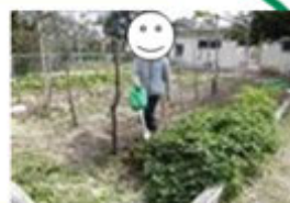
発見！小学部が水やり こくぼ