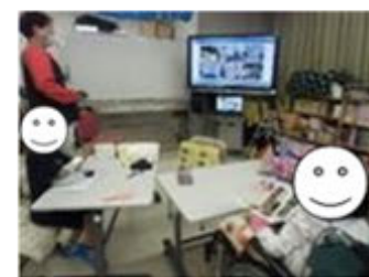
クイズにちょうせん！