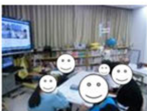
分教室のみんな にクイズ