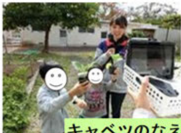
キャベツのなえだよ！