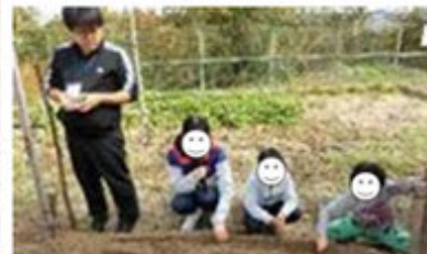
おせわ、おねがいね